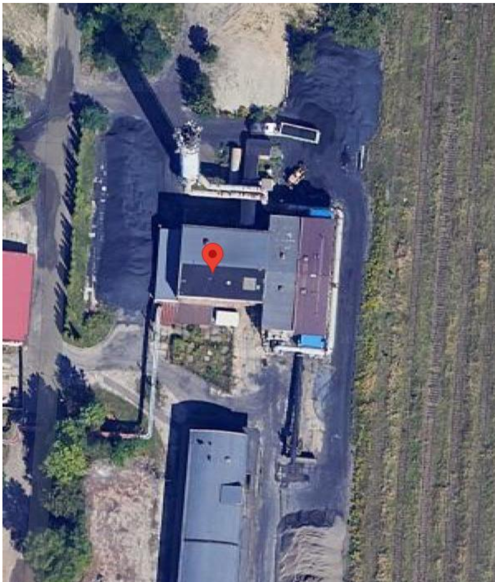
Rys.1. ZC Julian, ul. Gen. Ziętka 13b

Obecnie ciepłownie usytuowane są zbyt blisko domostw, co stanowi zagrożenie toksycznym skażeniem wód gruntowych, gleby i powietrza na skutek istnienia składowisk węgla. Poniżej zestawiono zdjęcia ciepłowni wycięte z mapy portalu google.pl/maps.