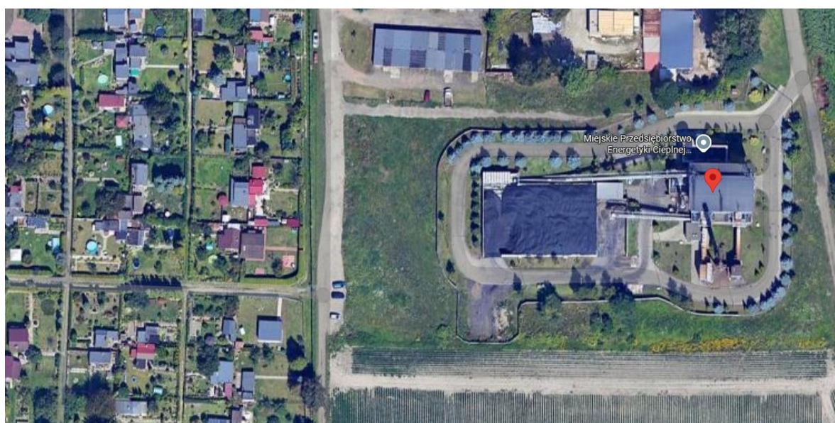
Rys. 3. ZC Andaluzja, ul. Marii Curie-Skłodowskiej 83B