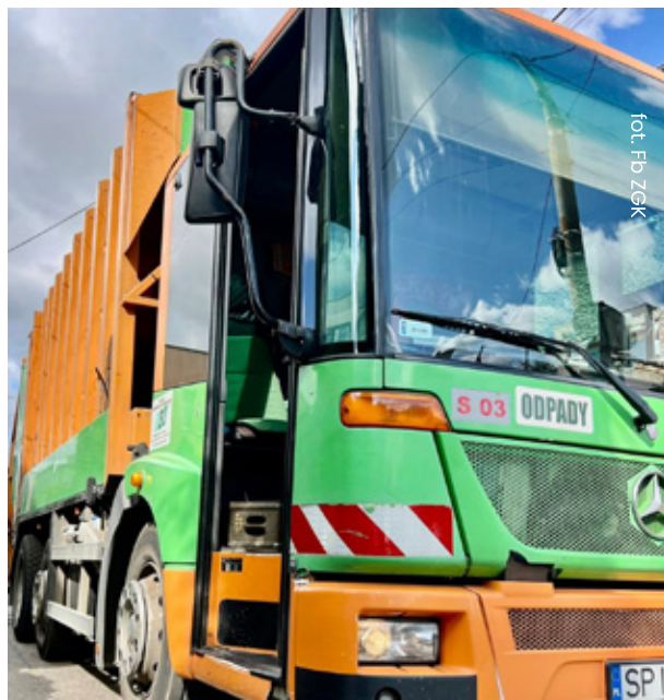
fol. Fb ZGK

Temat opłat za śmieci w Piekarach Śląskich wraca w kontekście rosnących kosztów w regionie. Dla porównania, od nowego roku w Jaworznie stawka wyniesie 51 zł od osoby, w Radzionkowie przy próbie ustalenia wysokości opłaty doszło do kontrowersji przy kwocie 47 zł, a w Wojkowicach stawka wzrosła do 43 zł. Podwyżki będą dotyczyły również naszego miasta, jednak jak informuje Wiceprezydent Krzysztof Turzański, dzięki dopłatom z budżetu uda się utrzymać cenę na rozsądnym poziomie. W tym roku miasto dopłaciło do systemu ponad 4 mln zł, a w budżecie na przyszły rok